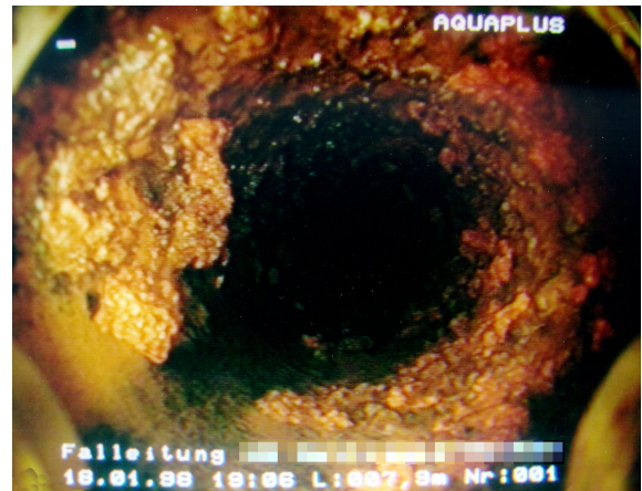
Untersuchung einer inkrustierten Leitung