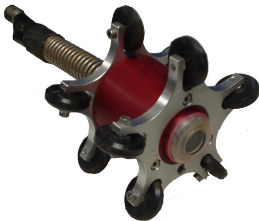
ab Ø 50 mm, mit Gestänge, maximale Länge 120 m